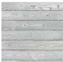
Play Oak Winter Plank