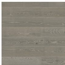
Play Oak Marble Plank